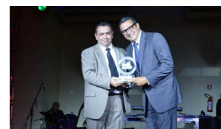
Melhor Informativo ONLINE CQCS