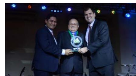
Melhor Seguradora de Saúde no Amazonas BRADESCO SEGUROS