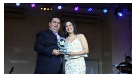
Melhor Seguradora Benefícios em Roraima CAPEMISA SEGURADORA