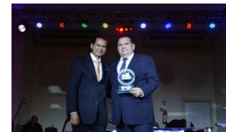
Seguradora do Ano na Opinião Popular BRADESCO SEGUROS