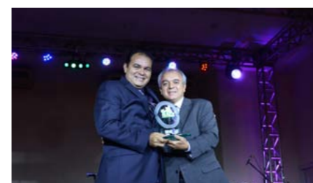
Melhor seguradora Auto no Amazonas HDI SEGUROS