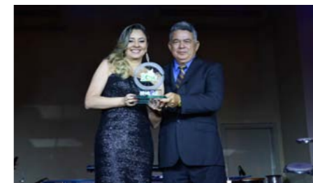
Seguradora Destaque de 2014 AMIL ASS. MEDICA