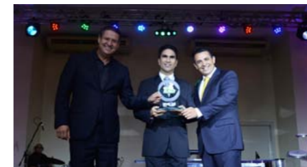
Melhor Corretora Saúde no Amazonas PROVISA CORRETORA