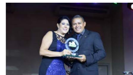
Melhor Seguradora Vida e Previdência no Amazonas PORTO SEGURO