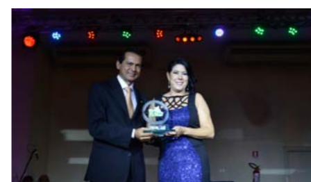
Grupo Segurador do Ano PORTO SEGURO