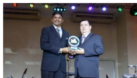
Melhor Corretora Ramo Elementares em Roraima - SPIES CORRETORA