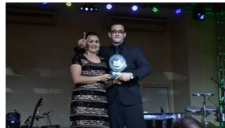
Melhor Corretora de Previdência no Amazonas TAUMATURGO CORRETORA

A Maruaga Corretora, além de receber o troféu de Melhor Corretora de Seguros do Ramo Multirrisco de 2012, levou mais dois trofeus: os de Melhor Corretora de Seguros no Ramo Vida e Melhor Corretora de Seguros no Ramo Multirrisco. Como Melhor Corretora no Ramo Saúde, a Provisa Corretora foi a escolhida. E, como Melhor Corretora de Seguros no Ramo Auto, o troféu foi para a Lesley Corretora.