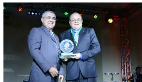
Melhor Corretora Multirrisco 2012 MARUAGA CORRETORA