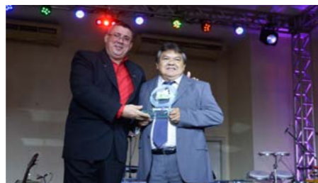
Melhor Prestadora de Serviços no Amazonas DEKRA VISTORIADORA