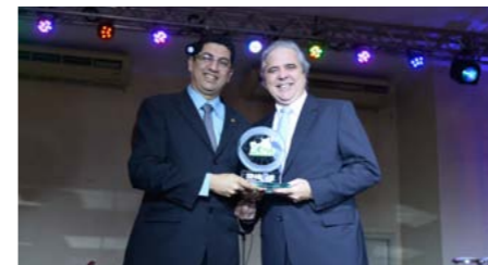
Melhor Corretora Vida no Amazonas MARUAGA CORRETORA

O evento contou com apoio da Federação Nacional dos Corretores de Seguros (FENACOR) e com o patrocínio das seguintes seguradoras e corretoras de seguros: Bradesco Seguros; Porto Seguros; HDI Seguradora; Allianz Seguradora; Yassuda Marítima; Amil Assistência Médica; Capemiza Seguradora; GBOEX Seguradora; Icatu Seguros; Mapfre Seguradora; Mitsui Seguradora;