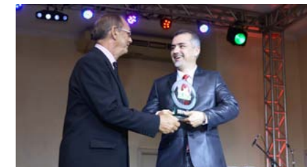
Melhor Corretora Multirrisco no Amazonas MARUAGA CORRETORA