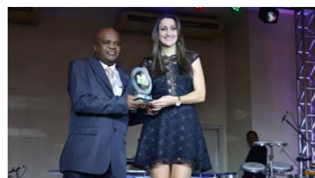
Melhor Corretora Ramo Benefícios em Roraima SABIO CORRETORA