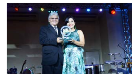
Melhor Seguradora Multirrisco no Amazonas TOKIO MARINE