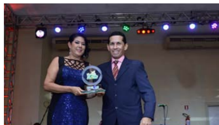
Melhor Seguradora Ramo Elementares em Roraima PORTO SEGUROS