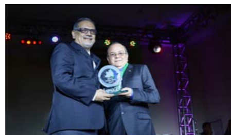
Melhor Corretora Multirrisco 2013 ACAFO CORRETORA