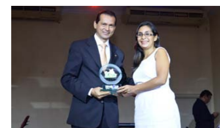
Jornal Impresso Local JORNAL A CRÍTICA

Tokio Marine; J. Malucelli; Zurich; GG Moura Corretora de Seguros; J. C. Neto Corretora de Seguros; Provisa Corretora de Seguros; Oficina Campos; Oficina Ataliba; Martins Import; Dekra Vistoriadora; e New Car Centro Automotivo.