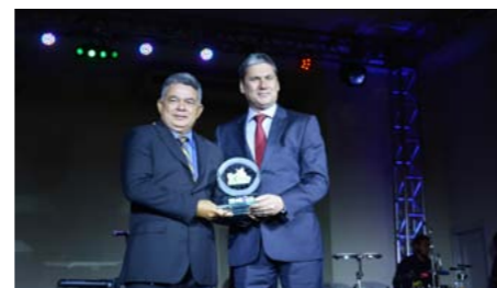
Melhor Revista Impressa de Seguros REVISTA APÓLICE