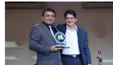
Melhor Corretora Ramo Auto no Amazonas LESLEY CORRETORA