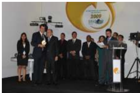
Melhor Empresa Corretora de Seguros no Estado de RORAIMA SPIES CORRETORA DE SEG. LTDA