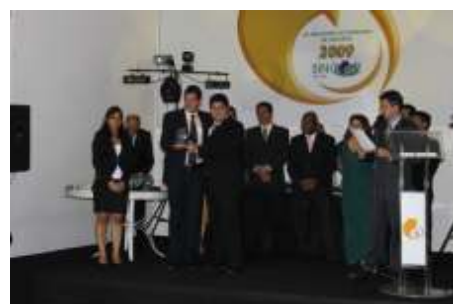
Melhor Grupo Segurador na OPINIÃO POPULAR SULAMÉRICA SEGUROS S/A