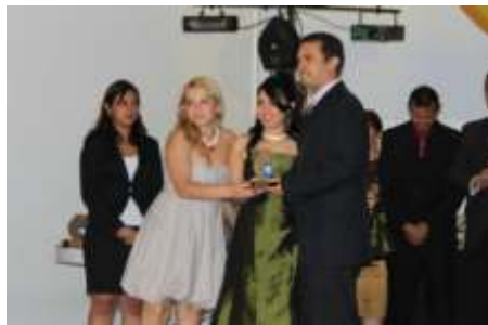
Prestadora de Serviços Destaque do Ano OFICINA LIMA CAR