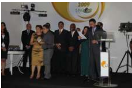
Melhor Empresa Prestadora de Serviços AUTOMOTIVO (OFICINAS) OFICINA CAMPOS