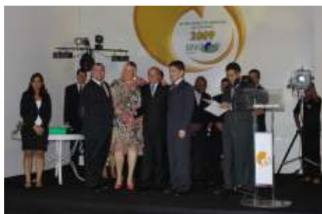
Melhor Grupo Segurador do Ano Bradesco Seguros e Previdência S/A