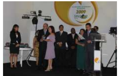
Melhor Corretora de Seguros no Ramo VIDA: ARANGÁ CORRETORA DE SEG. DE VIDA