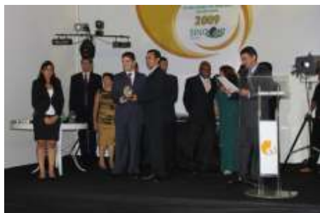
Melhor Seguradora no Ramo SAÚDE Bradesco Saúde S/A