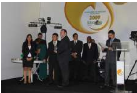
Melhor Seguradora no Ramo MULTIRISCO: Bradesco Auto/RE Cia de Seguros