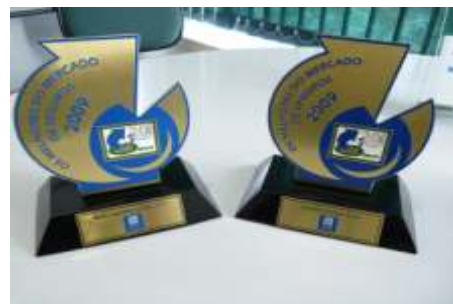
Melhor Seguradora no Ramo AUTO / DESTAQUE DO ANO PORTO SEGURO SEGUROS