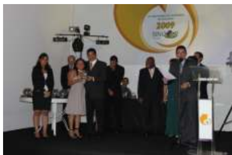
Melhor Corretora de Seguros no Ramo SAÚDE: ZENTAI HOKEN CORRETORA DE SEG.