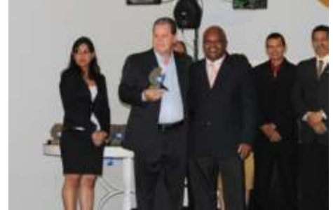
Melhor Empresa Prestadora de Serviços VISTORIA PRÉVIA / REGULADORA: ALPHA VISTORIADORA