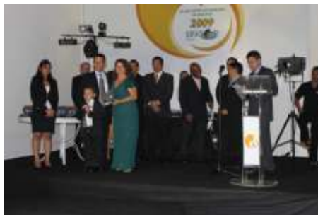
Melhor Corretora de Seguros no Ramo PREVIDÊNCIA: PARADISE CORRETORA DE SEG.