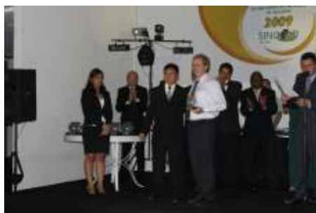
Melhor Corretora de Seguros no Ramo MULTIRISCOS: SIEL CORRETORA DE SEGUROS