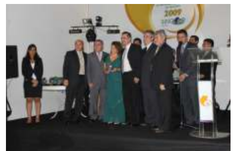
Melhor Corretora de Seguros no Ramo AUTO: MARUAGA CORRETORA DE SEGUROS