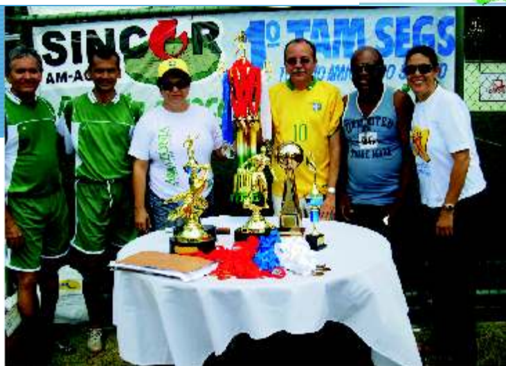
SANGUE NOVO/SINCOR (Sindicato)- G.G. MOURA, LESLEY e TAMUZ (Corretoras de Seguros) – PORTO SEGURO, BRADESCO AUTO/RE, MITSUI e BRADESCO VIDA E PREVIDÊNCIA (Seguradoras) - AUTO PRONTO e CAMPOS (Oficinas) alem da ACAPU /HDI/TOKYO MARINE (Misto de Corretora e Seguradoras).

O campeonato prossegue por mais três sábados seguidos, onde ao final se conhecerá os 1º. 2º. e 3º. Lugar, o melhor artilheiro, o melhor goleiro, e principalmente a equipe mais disciplinada. Entre: